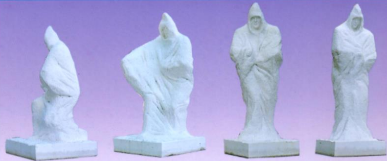
一場 二場 三場 四場