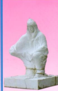
一場 二場 三場 四場

風化に強い銅像ではありません。 あえて風化に弱い大理石像にしました。自然環境の悪化を敏感に表現する大理石ですから1000年、2000年あるいは100年、200年でボロボロになるかもしれません。