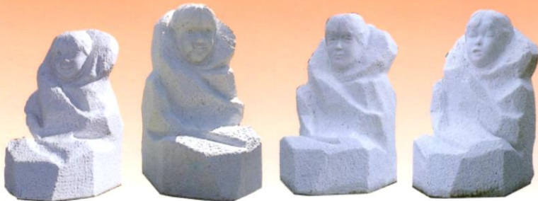
一章 二章 三章 四章